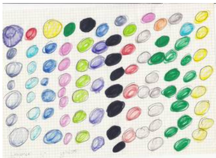
Uova di Pasqua