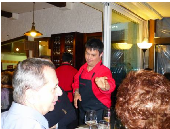
"Ghe pensi mi" (boh si dice così?)

Adesso, questi di seguito siamo noi ragazzi al lavoro insieme ai genitori che vengono a mangiare nel nostro ristorante Elisa