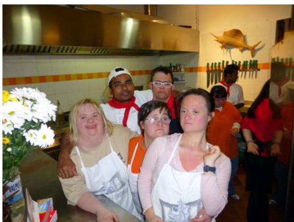
Cinque "belli" come un mazzo di margherite