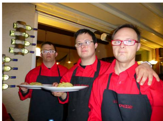
I tre dell'Ave Maria