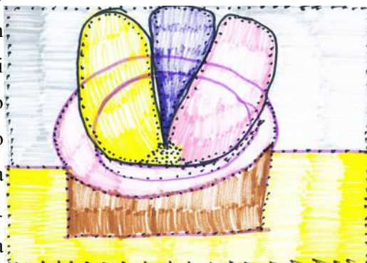
la fiamma delle special olympics