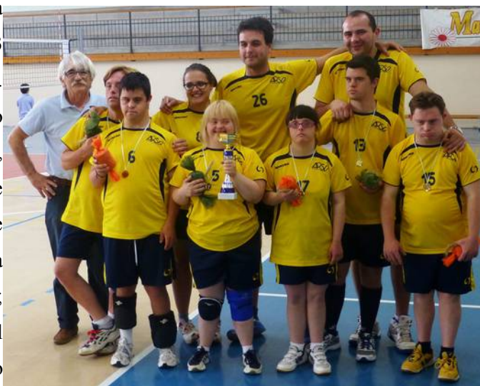
pallavolo ad Albenga